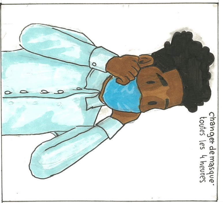
changer de masque toutes les 4 heures