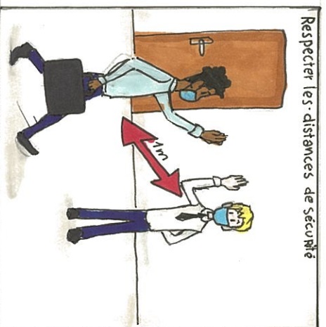
Respecter les distances de sécurité